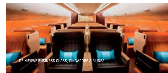
DE NIEUWE BUSINESS CLASS, SINGAPORE AIRLINES

De frequent flyer zal wel weten dat de ene business class de andere niet is. Wie innovatief in de lucht is, scoort goed maar ook ouderwetse hoffelijkheid aan boord en lekkere maaltijden worden zeer gewaardeerd.