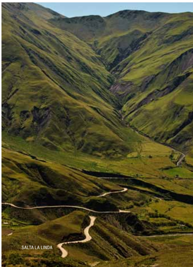
SALTA LA LINDA

Veelal blijkt het westen van een land minder druk te zijn, minder bekend en niet zo populair. Vaak onterecht.