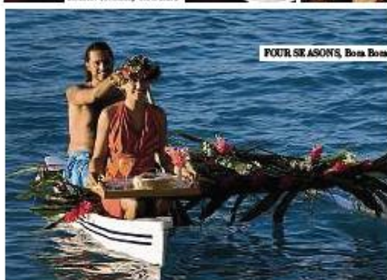
FOUR SEASONS, Bora Bora