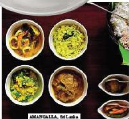
AMANGALLA, Sri Lanka