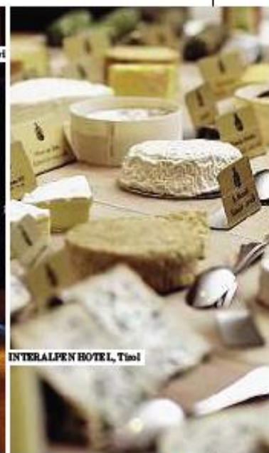
INTERALPEN HOTEL, Tirol