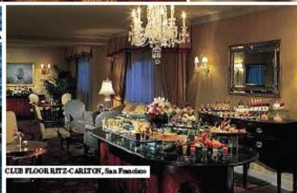
CLUB FLOOR RITZ-CARLTON, San Francisco